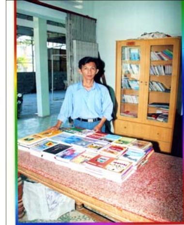
Thư viện ấp Tân Lập, Củ Chi, Tp HCM nhận sách báo đợt 1-2006