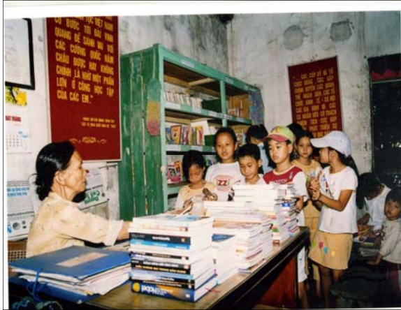
Thư viện thôn Giang Cao, Gia Lâm, Tp Hà Nội, nhận sách báo đợt 1-2006