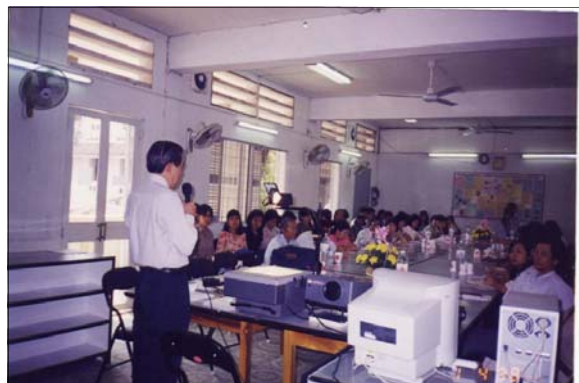
Hội thảo tại TV Cao Học, ĐH. Khoa Học Tự Nhiên, TpHCM, 2-4-1998

Sau đó người viết đã vào Tp HCM và với tư cách đại diện cho LEAF-VN đã đến thuyết